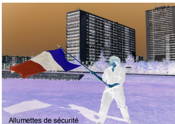
Allumettes de sécurité

Le fait, au cours d'une manifestation organisée ou réglementée par les autorités publiques, d'outrager publiquement l'hymne national ou le drapeau tricolore est puni de 7 500 euros d'amende.